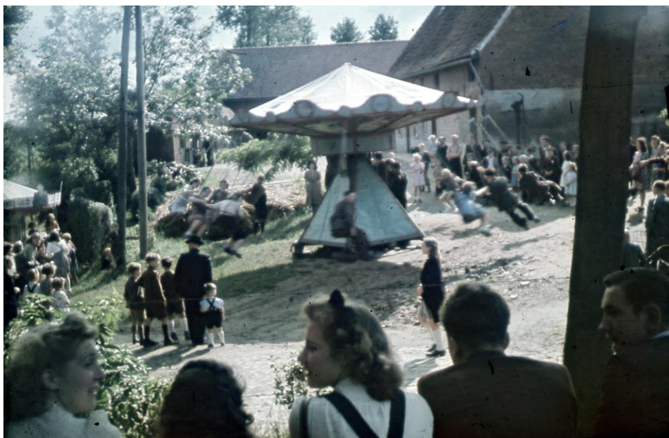
Enkele sfeerbeelden van de “kermisvreugd” in het centrum van Kiezegem in de zomer van 1944.