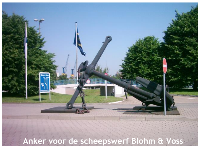
Anker voor de scheepswerf Blohm & Voss