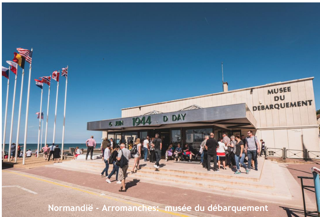
Normandië - Arromanches: musée du débarquement