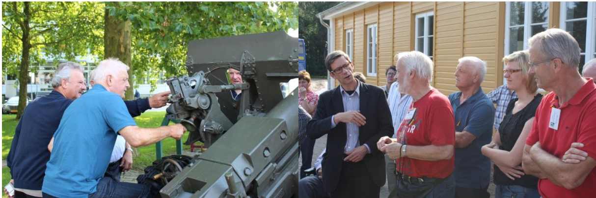
Kanoniers in Arnhem (EV & JD)