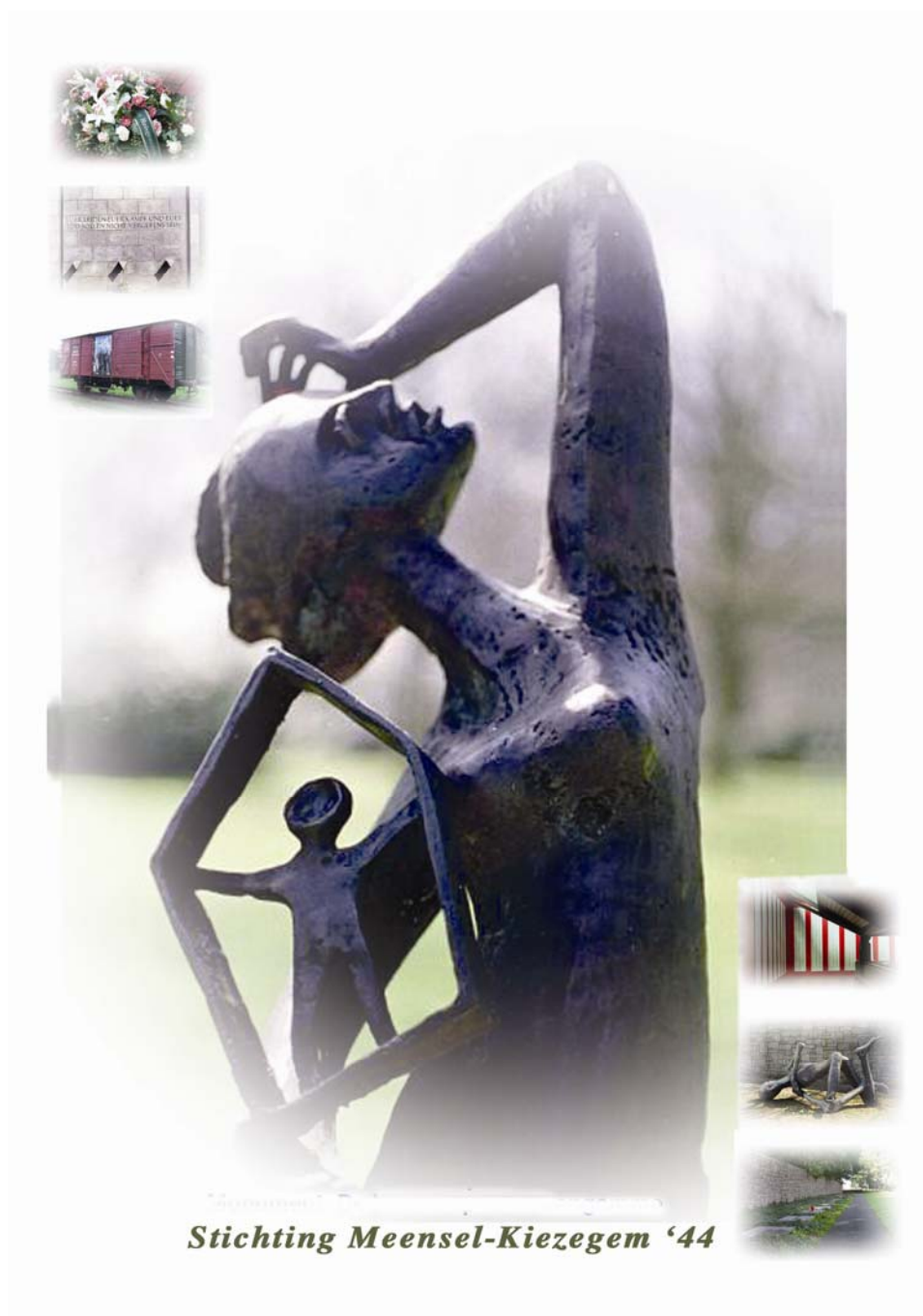
Stichting Meensel-Kiezegem '44