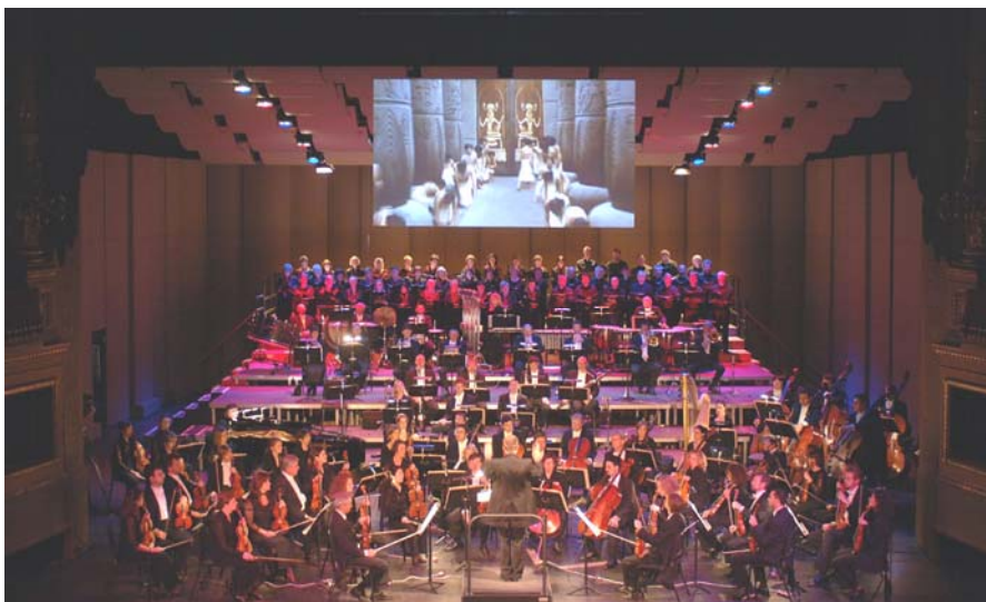
Het koor Cantata Ludens tijdens Polisch Composers, 20 oktober 2005 in Opera Gent