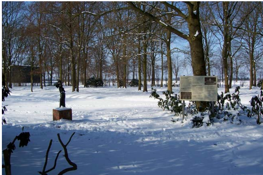
Winterbeeld van "De Wanhoop van Meensel-Kiezegem" – KZ Neuengamme (door Andreas Lapphön)