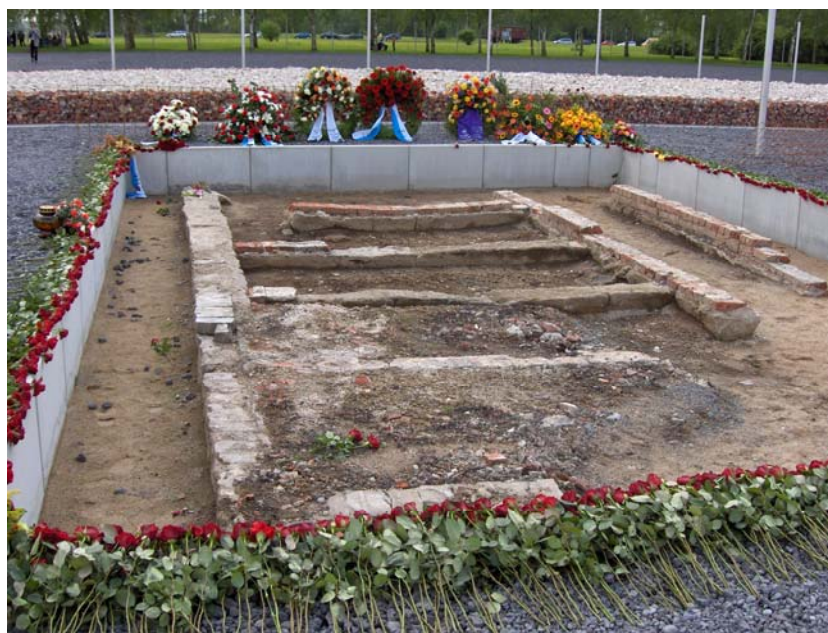
Overblijfsels van de dodencel in Neuengamme

Wil je graag deze schitterende reis meemaken, aarzel dan niet contact op te nemen met René Cauwbergs, want de plaatsen zijn beperkt! Je bent ingeschreven na betaling van een voorschot van 100 euro op het rekeningnummer 149-0567841-75