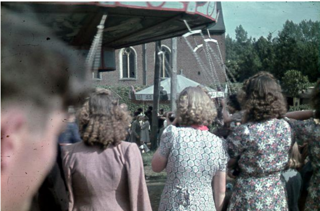
foto onder : laatste kermis voor de razzia's in juli 1944 in Kiezegem aan de kerk