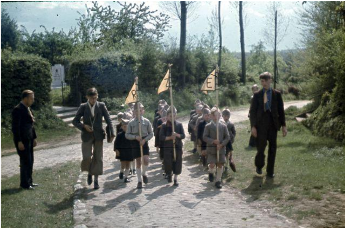
foto boven : Aan de kerk in Kiezegem. Op de achtergrond de toegang tot de kerk, rechts de baan naar St. Joris Winge, toen nog in onvervalste kasseistenen.