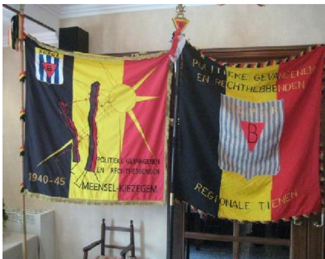
Gewest Meensel-Kiezegem en Tienen

De leden van het bestuur van de N.C.P.G.R. gewest Meensel-Kiezegem -Tienen nodigen U graag uit op de jaarlijkse feestvergadering op :