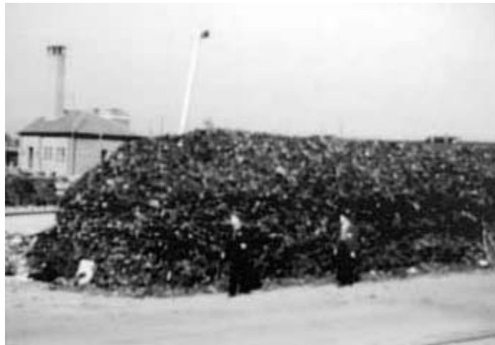
Schoenen van de overledenen naast het Crematorium van KZ Neuengamme

Ik zou misschien wel in mijn eigen naam kunnen vergeven, maar ik kan niet spreken voor de miljoenen die ze hebben vermoord.