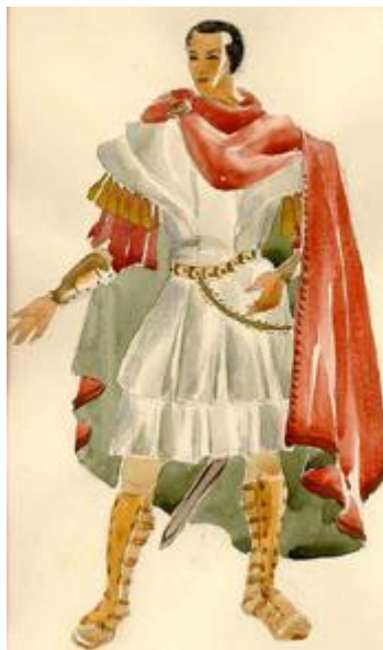
Generaal Varus, bevelhebber van de legioenen van keizer Augustus.