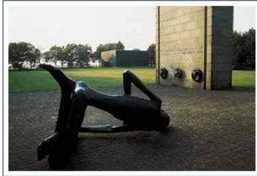
De gevallen gevangene en de symbolische schoorsteen in het KZ Neuengamme

Toen Hitler in 1933 aan de macht kwam in Duitsland , richtte zijn Nazipartij concentratiekampen in. In zulke totalitaire regimes werden personen die als gevaarlijk worden beschouwd geïnterneerd. Dat kon tevens om politieke, ethnische of andere (soms fictieve ) redenen zijn. Vooral Joden , zigeuners, anders-geaarden en politieke tegenstanders van het regime waren de slachtoffers. Alhoewel in al die kampen moest gewerkt worden en de mensen mishandeld en gedood werden, waren er ook vernietigingskampen, die enkel tot doel hadden mensen massaal om te brengen. Miljoenen kwamen zo om, waaronder 6 miljoen Joden. Naast Neuengamme zijn de meest gekende kampen: Buchenwald (DI), Dachau (DI), Auschwitz (PI), Vught (NI), Sobibor (PI) en Breendonk (B).