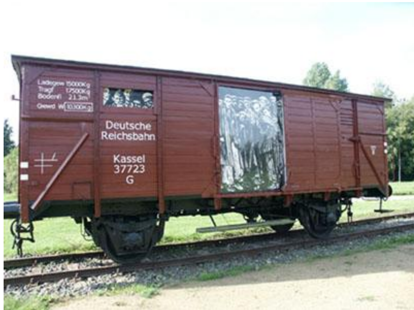
De gevangenen werden in een beestenwagon vervoerd