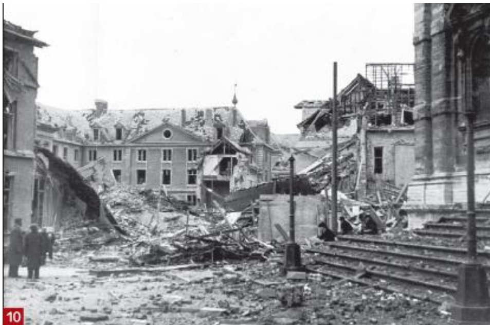
Naamsestraat te Leuven, na de bombardementen

Als iedereen vergeet, kan hetzelfde opnieuw gebeuren, over twintig, vijftig of honderd jaar. (Simon Wiesenthal – gestorven in 2005)