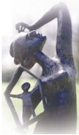
De Wanhoop van Meensel-Kiezegem

b) Wat stelt het beeld voor en wie maakte het? (D)