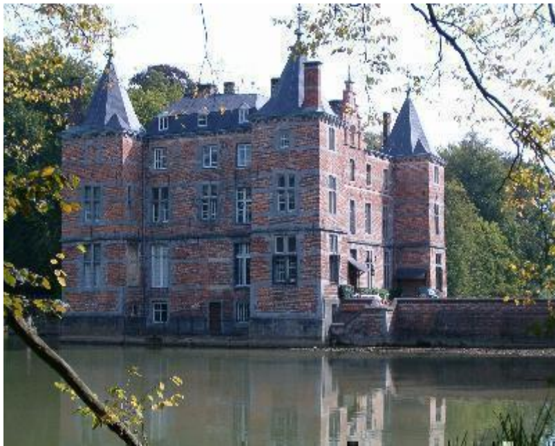
Op deze plaats werd de capitulatie onderschreven

Wie naar getuigen luistert, wordt zelf getuige (Elie Wiesel, overlevende Auschwitz-Nobelprijs voor de vrede 1986)