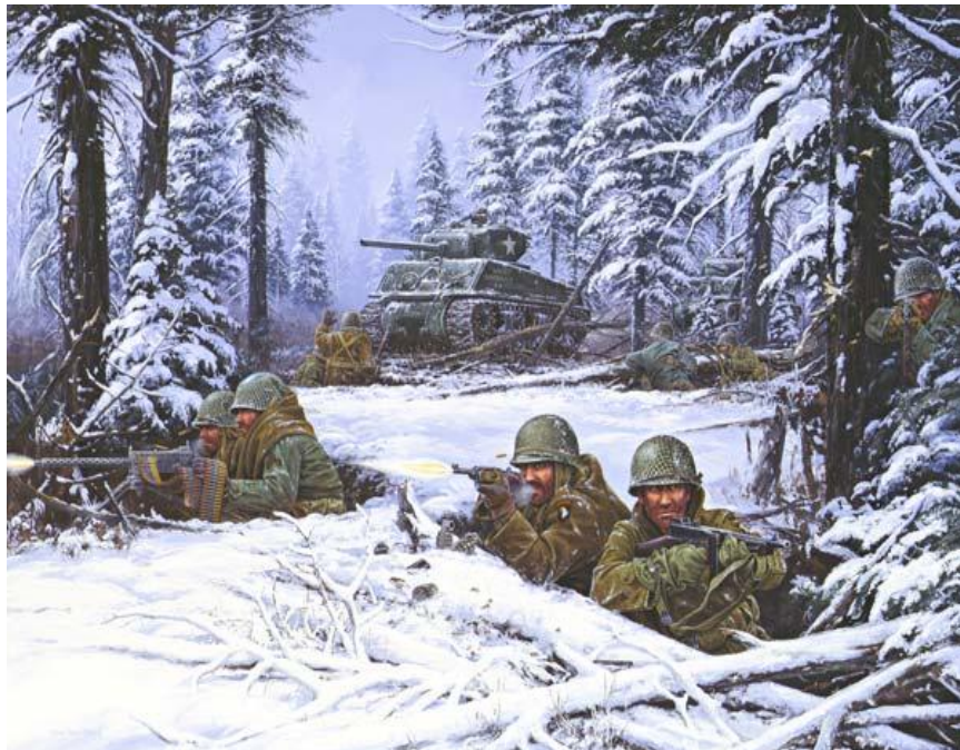
Ardennenoffensief in Bastogne